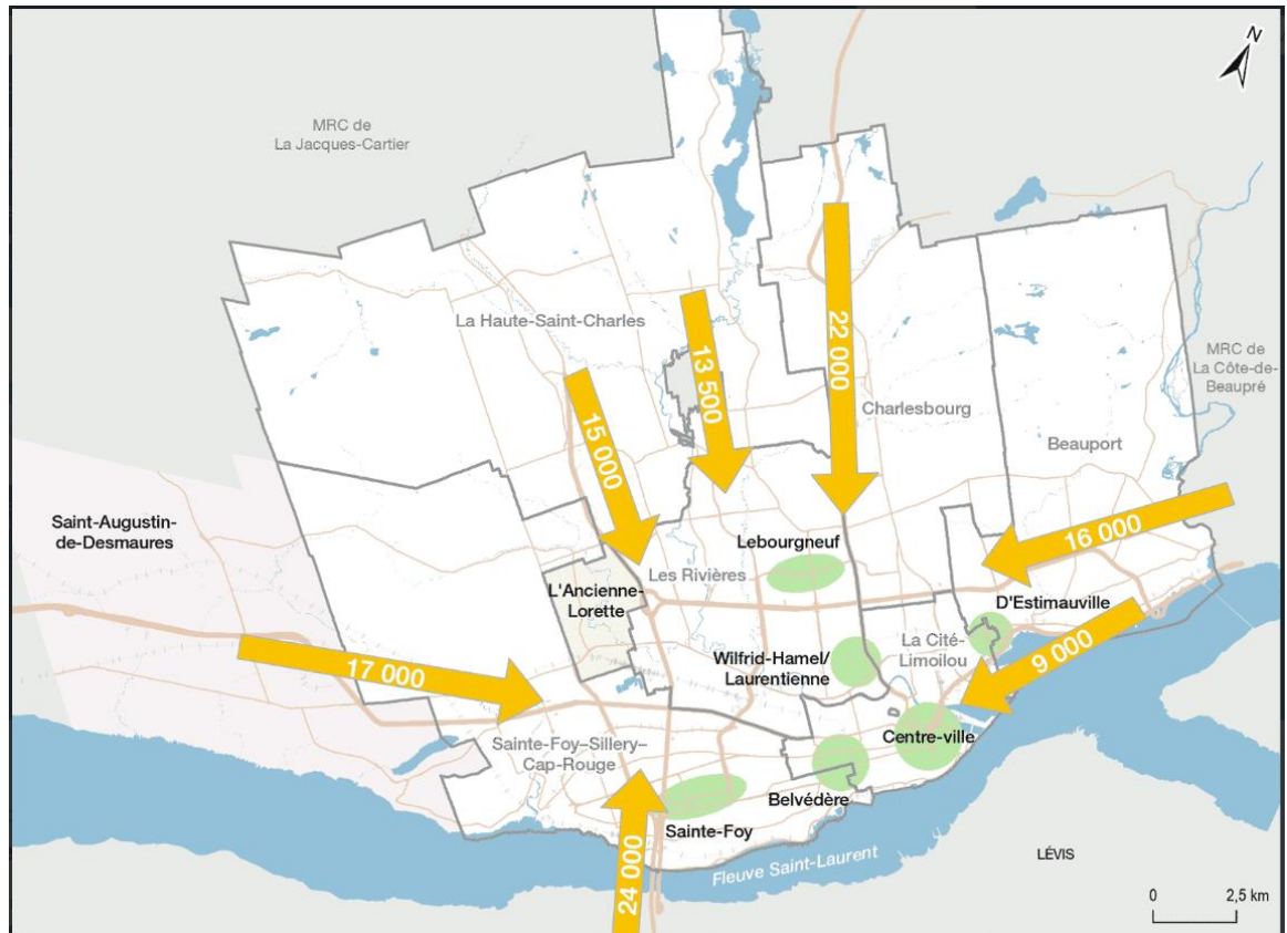
Illustration 1 : Carte des flux quotidiens de déplacement.