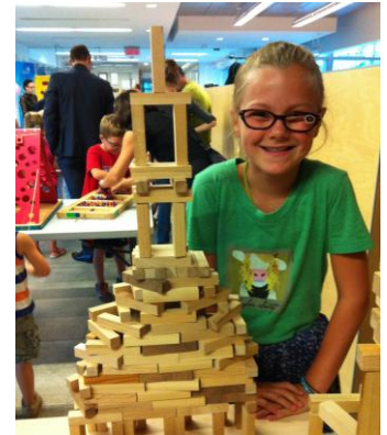
Jeux mabouls de Général Patente

Le Général Patente sera présent sur place avec ses nombreuses tables de jeux pour vous divertir. Les enfants seront invités à participer à une Chasse au trésor. Le plaisir sera au rendez-vous!